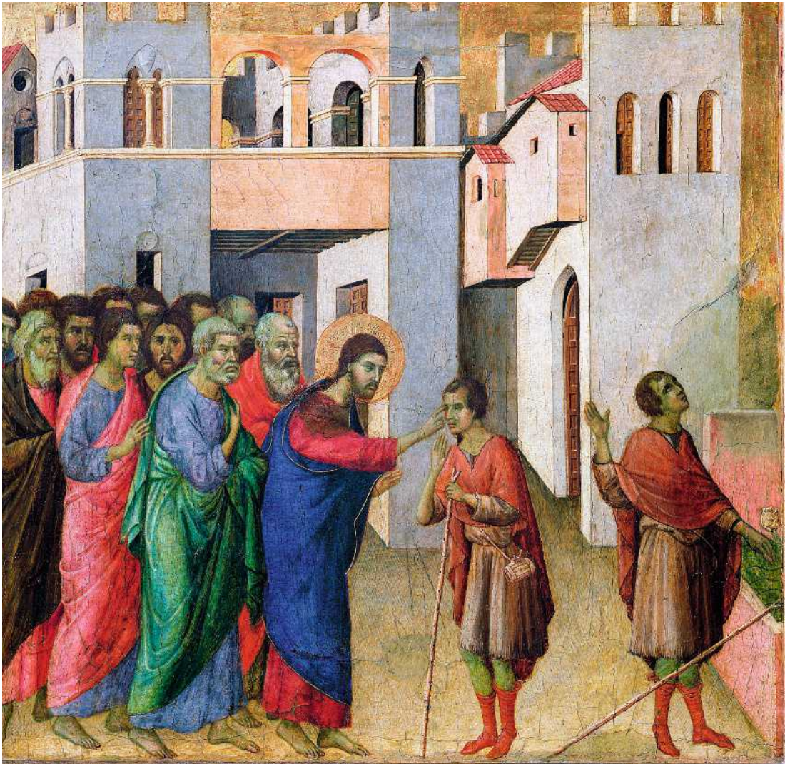
Duccio di Buoninsegna, La guérison de l'homme né aveugle , 1308-1311.

Pour la religion, le passé est en général beaucoup plus précieux que le présent ou l'avenir : ce n'est pas pour rien que tous les grands miracles ont eu lieu dans un passé lointain. Plus ce « miracle » est éloigné dans le temps, plus nous sommes censés y croire. De nos jours, les miracles se produisent très rarement : Dieu est probablement déçu par ses créatures et a cessé de nous aimer... Sinon, pourquoi ne nous apparaîtrait-il pas comme à Moïse ? Pourquoi ne nous salue-t-Il pas depuis le Ciel ?