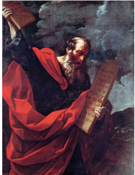
Socrate et Moïse.